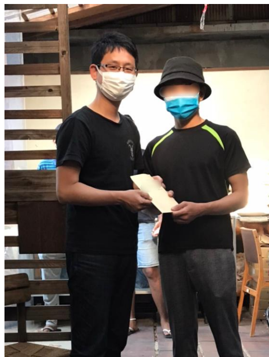
支援金を渡している様子