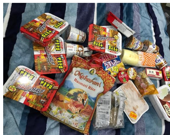
支援で購入した食べ物