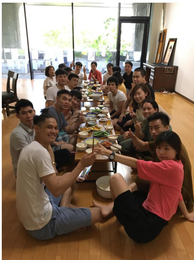
シェルターでの食事の様子

●ご家族で受け取りにいらっしゃいました。当初はどうなることかと心配でしたが、なんとか部屋にも入ることができ、居候や野宿生活からは脱出することができたようです。ただ、支援金がなくなってしまった、その後が心配です。(30代夫婦)