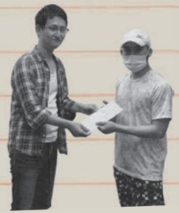
新型コロナ 「移民・難民緊急支援基金」報告書